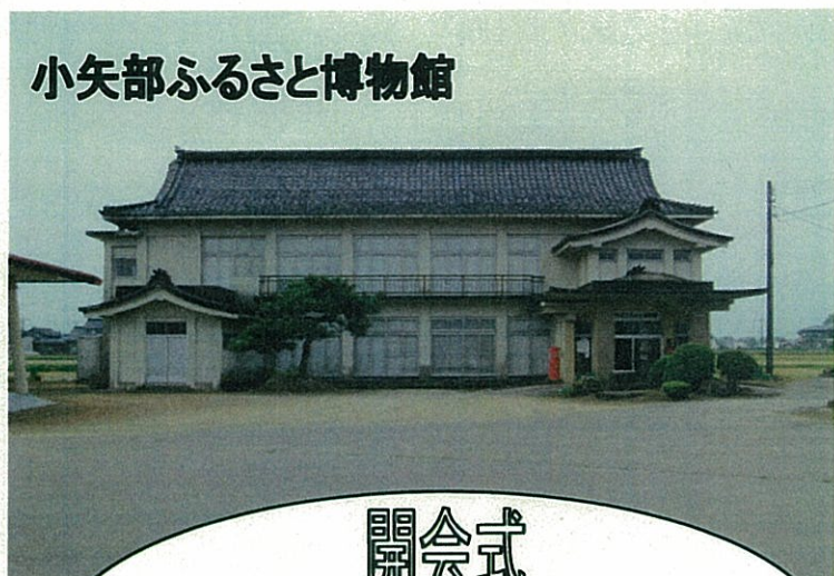
小矢部ふるさと博物館

この展示を通して、兄弟の生き方や考え方を学び、子供たちには将来の大きな夢や希望を持ってもらい、そして達成して欲しいと思います。